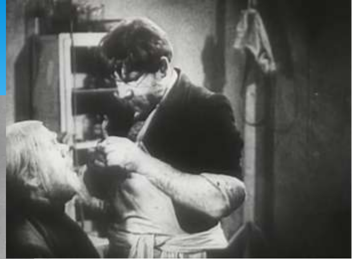
Доктор кадр из филма "Хирурги"